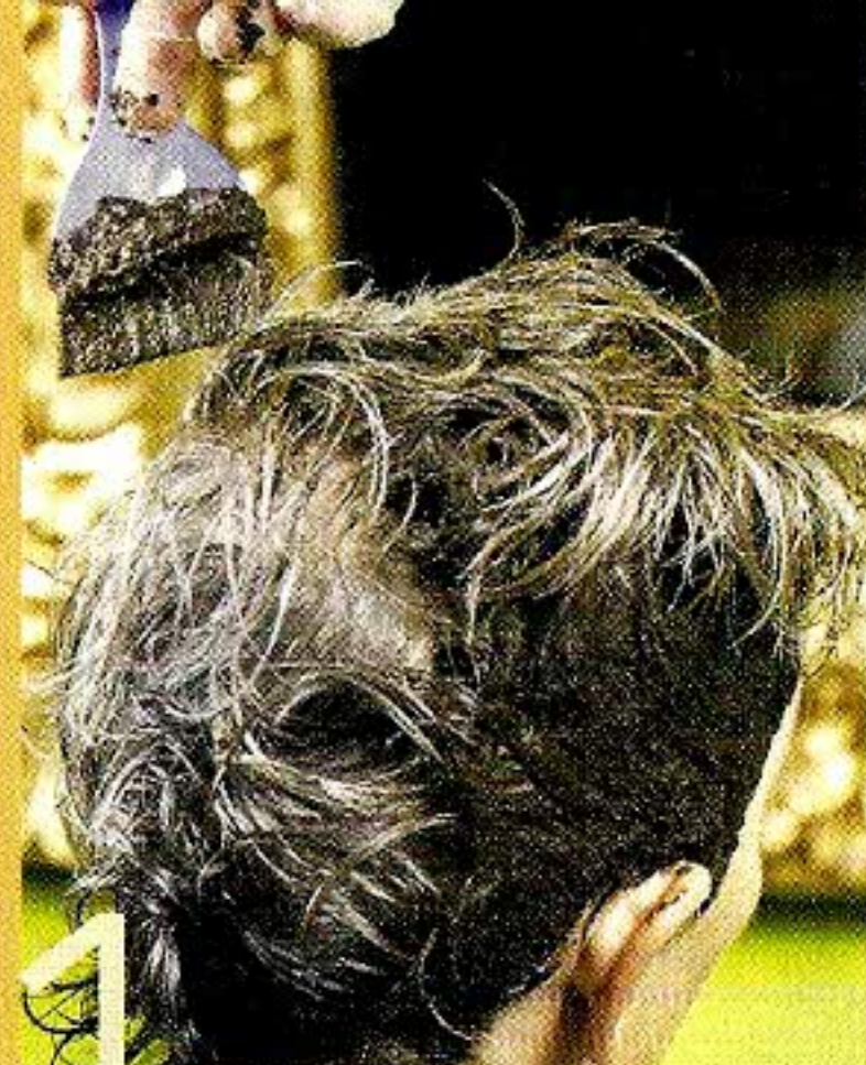
L'épaisse pâte végétale est appliquée au pinceau sur une chevelure humide.