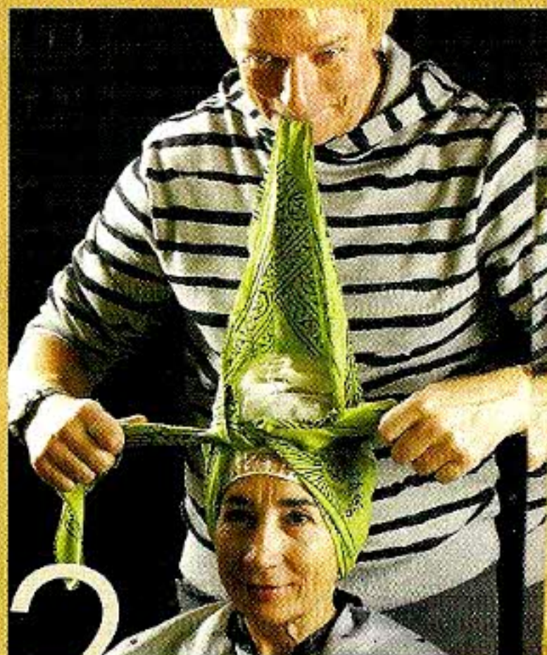
Les cheveux sont emballés dans du papier ménager, enfermés dans un bonnet de plastique, recouvert d'un foulard.

Le métier de coiffeur est classé en groupe 2A par le Centre international de recherche sur le cancer de Lyon, soit comme probablement cancérigène pour l'homme en raison des produits chimiques utilisés. L'une des substances montrées du doigt par Jean Estoppey est le sodium lauryl (ou laureth) sulfate . La plupart des shampoings en contiennent. «Ce produit détergent n'a pas été évalué par notre centre en raison du manque de soupçon cancérigène à son sujet», commente le Dr Nicolas Gaudin. Il n'est a priori pas dangereux pour la santé .»